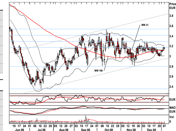
Grafico del giorno: Mediolanum

Continua il recupero dai minimi dello scorso luglio, con il titolo Mediolanum che si è riportato in area EUR3 anche per effetto dell'incrocio rialzista delle medie mobili avvenuto verso fine settembre. In caso di continuazione del movimento rialzista di breve periodo, il deciso superamento di EUR3,165 potrebbe condurre le quotazioni verso i recenti massimi relativi di dicembre a EUR3,285, quindi verso EUR3,40 e, successivamente, EUR3,53, sui massimi di ottobre '08 (da segnalare che al momento, la parte superiore del canale rialzista di breve periodo si trova in area EUR3,80).